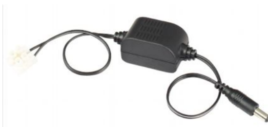
Рис.1 Внешний вид PC500