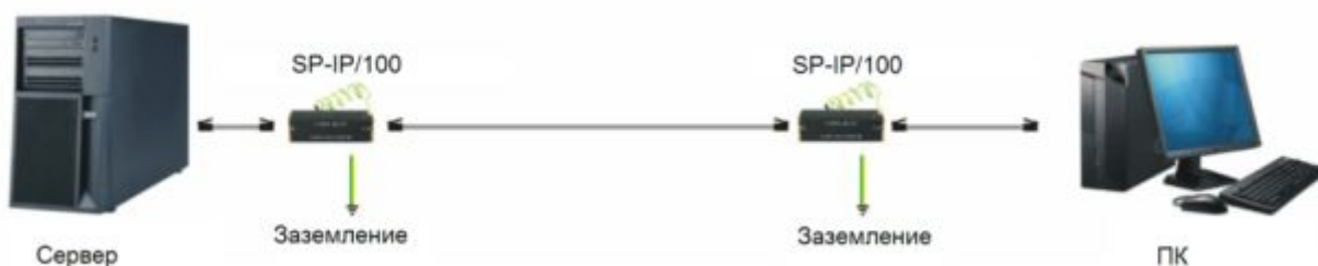
Рис.3 Подключение SP-IP/100