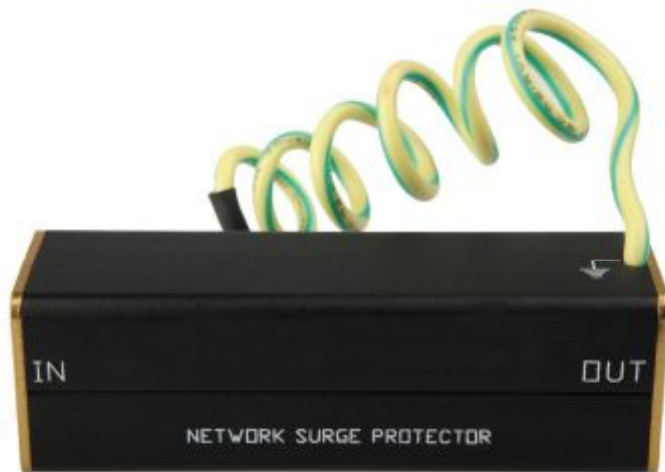
Рис.1 Внешний вид SP-IP/100