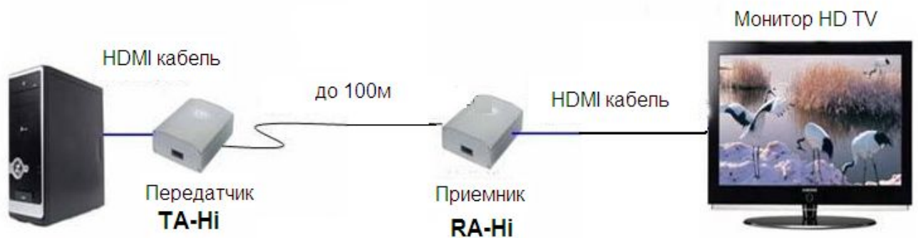
Рис.3 Схема подключения передатчика TA-Hi и приемника RA-Hi