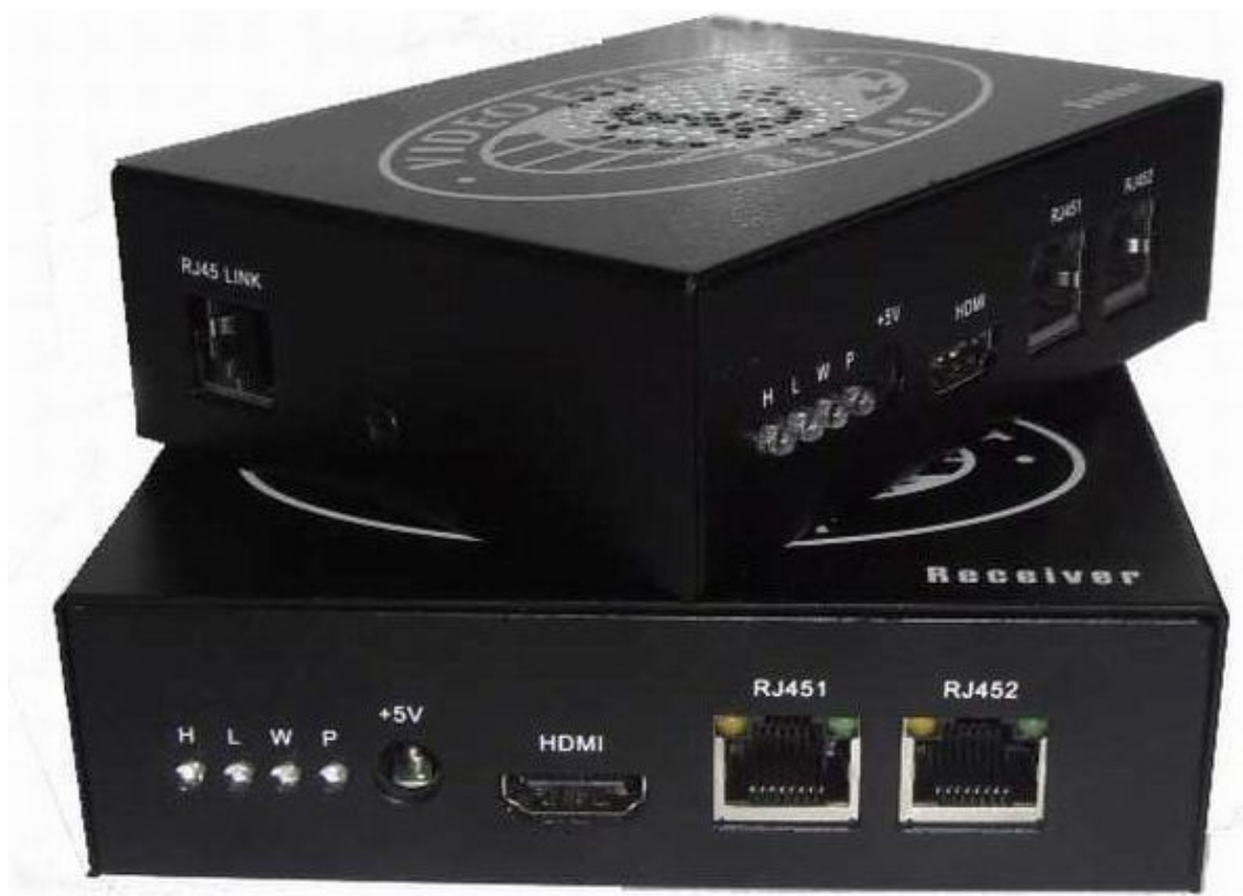
Рис.2 Внешний вид передатчика TA-IPHi и приемника RA-IPHi