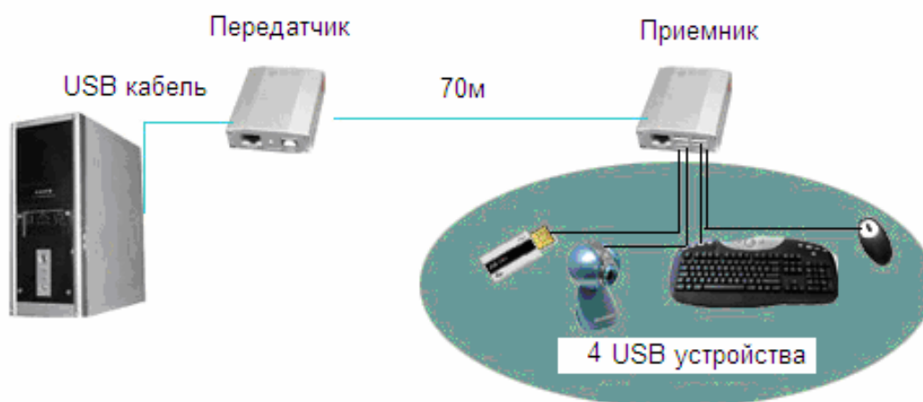
Рис.2 Подключение комплекта TA-U1+RA-U4