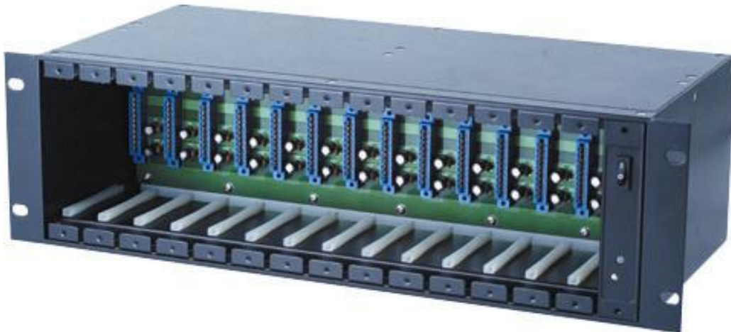
Рис. 1 Внешний вид бокса TRN012.