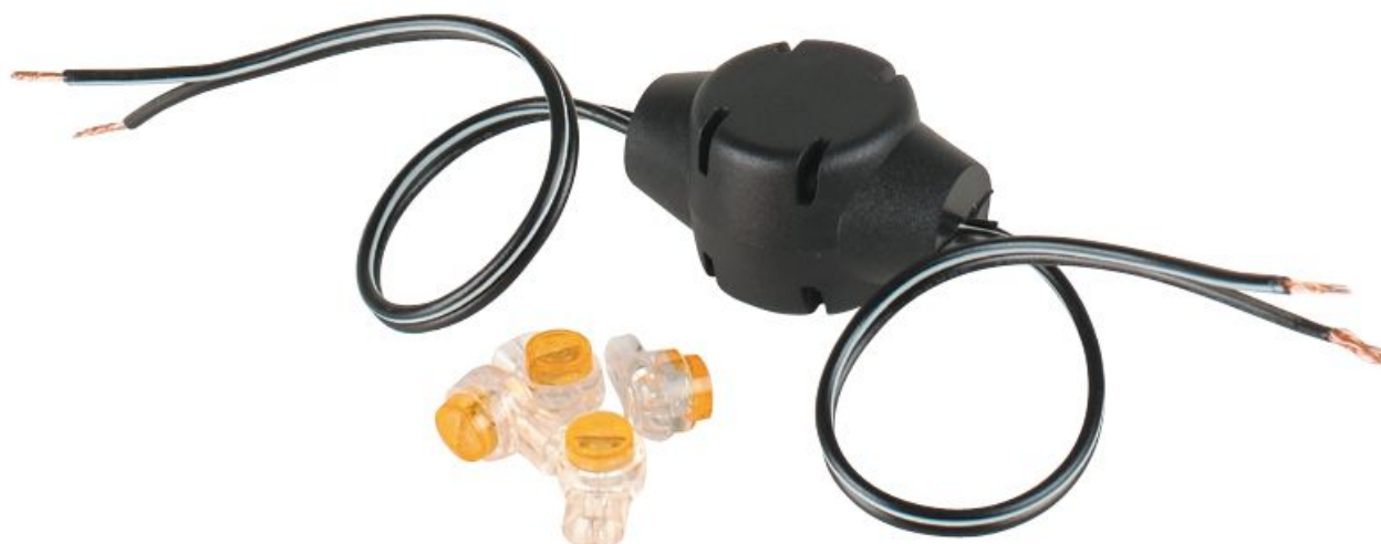
Рис.1 Внешний вид ТТР111VB .