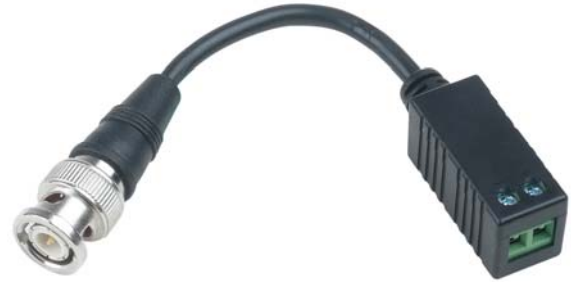
Рис.1 Внешний вид ТТР111VE, ТТР111VEL