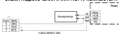
СХЕМА ПОДКЛЮЧЕНИЯ К СОМ-ПОРТУ КОМПЬЮТЕРА