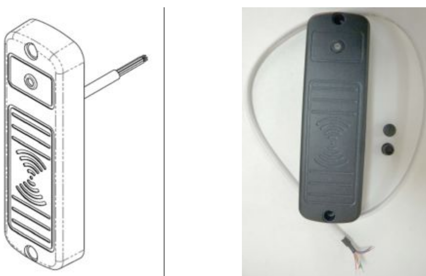
Рис. 1 Внешний вид УСК-02М

1.4 Средний срок службы не менее 10 лет.