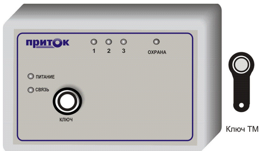
Рис. 1. Вид передней панели прибора.

Прибор рассчитан на круглосуточную эксплуатацию в закрытых непожароопасных помещениях категории размещения ОЗ по ОСТ 25 1099, при температуре от минус 30 до плюс 45 °С, относительной влажности воздуха до 85%, отсутствии в воздухе пыли, паров агрессивных жидкостей и газов (кислот, щелочей и пр.).