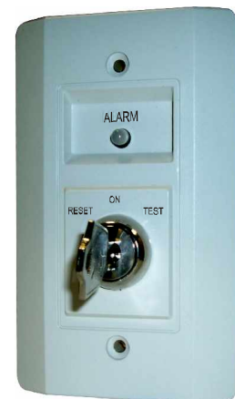
Рис. 1. Выносной пульт управления RTS451KEY

Выносной пульт управления RTS451KEY предназначен для контроля и дистанционного тестирования, линейных дымовых извещателей 6500R, 6500RS или 6424 и извещателей серий DH400 устанавливаемых в воздуховодах. На передней панели выносного пульта управления расположен двухцветный светодиодный индикатор зеленого и красного цвета и устройство запуска теста. Зеленый цвет светодиода предназначен для индикации напряжения питания извещателя, а красный цвет для индикации режима "Пожар". Устройство запуска теста имеет с фиксацией две позиции "ON" и "TEST" и одну без фиксации позиции (с самовозвратом) "RESET".