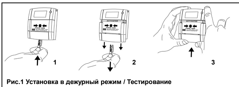
Рис.1 Установка в дежурный режим / Тестирование

Возврат в дежурный режим извещателя с приводным элементом в виде пластиковой пластины (рис.1) осуществляется при помощи специального ключа, поставляемого в комплекте с извещателем. Для этого ключ вставляется в двойное отверстие в нижней части кассеты (полурамки), удерживающей приводной элемент, кассета вместе с ключом и приводным элементом сдвигается вниз относительно корпуса извещателя приблизительно на 1 см, ключ удаляется из кассеты и кассета возвращается в первоначальное положение путем сдвига её вверх до упора. Пластиковая гибкая пластина не требует замены в течении всего срока эксплуатации.