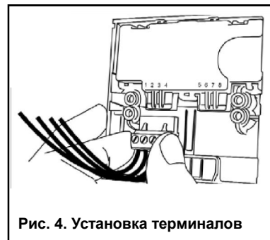
Рис. 4. Установка терминалов