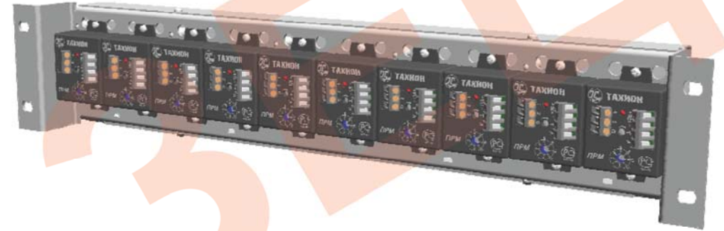
Каркас для установки в стойку приёмников АПВС(-3М; -5М; -5АНД) (до 10 шт)