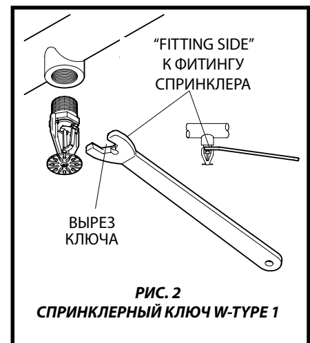
РИС. 2 СПРИНКЛЕРНЫЙ КЛЮЧ W-TYPE 1

Шаг 4. После установки проверьте целостность соединителя каждого спринклера ESFR-25. В особенности проверьте, чтобы соединитель и крюк имели положение, показанное на Рис. 1, и чтобы соединитель не был искривлён, согнут