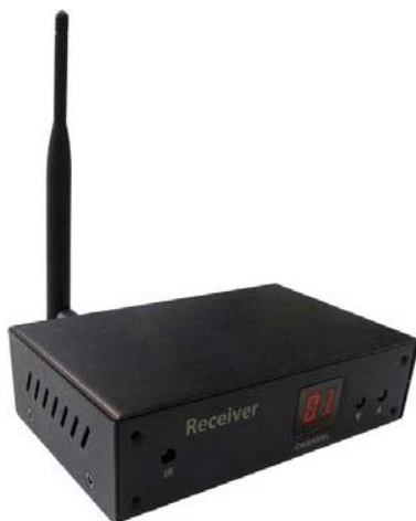
Рис.1 Внешний вид WR5.8