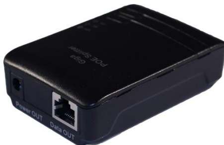
Рис. 1. Сплиттер PoE Splitter/1