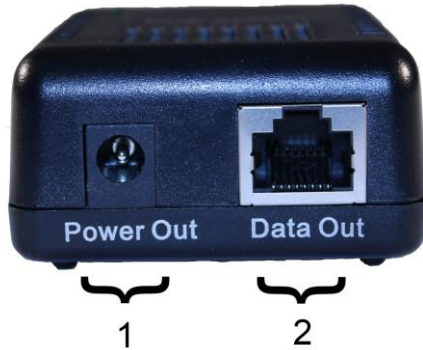
Рис. 2. Сплиттер PoE Splitter/G2 , вид спереди