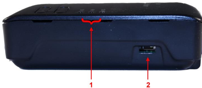
Рис. 4. Сплиттер PoE Splitter/G2 , вид сбоку