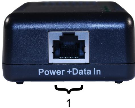
Рис. 3. Сплиттер PoE Splitter/G2 , вид сзади