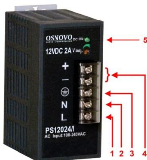
Рис. 1. Блок питания PS-12024/I, PS-48048/I