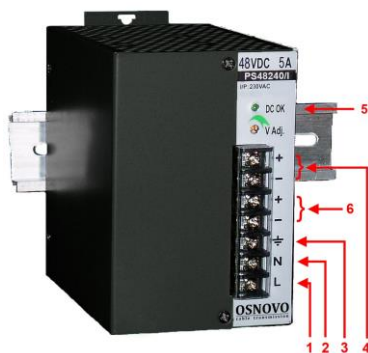
Рис. 2. Блок питания PS-48150/I, PS-48240/I