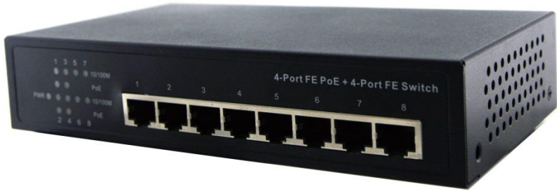
Рис.1 Коммутатор SW-20800/HB