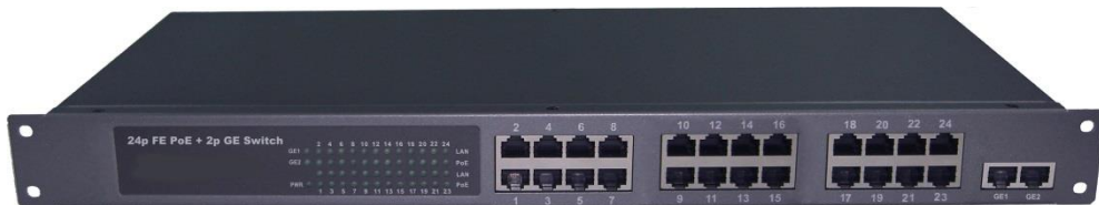
Рис.1 Коммутатор SW-62422/B