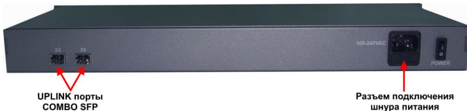
Рис. 3 Коммутатор SW-62422/B, вид сзади