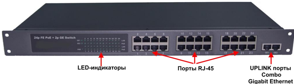
Рис.2 Коммутатор SW-62422/B, вид спереди