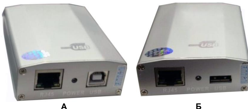
Рис.1 Внешний вид TA-U1/3 (A)+RA-U1/3(Б)