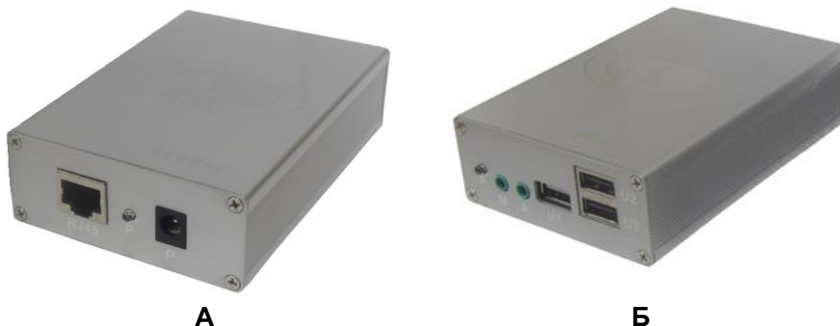
Рис.1 Внешний вид TA-U1/4 (А)+RA-U3/4(Б)