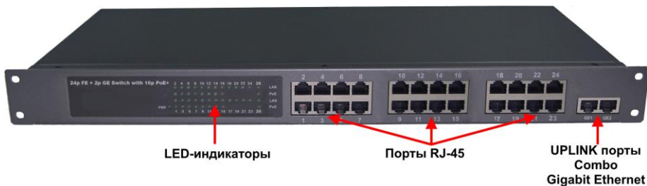
Рис.2 Коммутатор SW-62422/HB, вид спереди