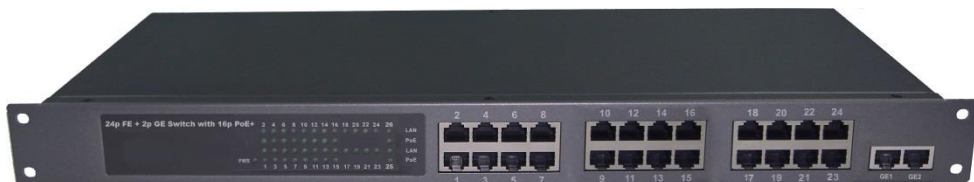
Рис.1 Коммутатор SW-62422/HB