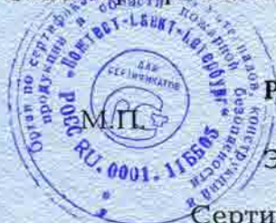
Схема сертификации За