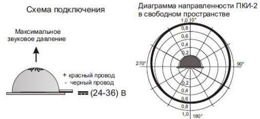
Рис.2 Схема подключения и диаграмма направленности оповещателя ПКИ-2.

5.3. На рис.2 показана схема подключения и диаграмма направленности звука оповещателя ПКИ-2.