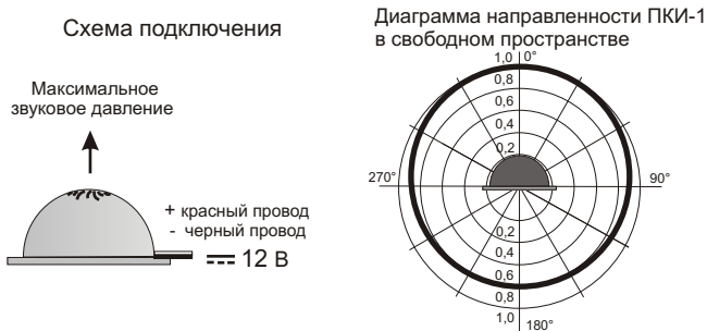
Рис.2 Схема подключения и диаграмма направленности оповещателя ПКИ-1.

5.3. На рис.2 показана схема подключения и диаграмма направленности звука оповещателя ПКИ-1.