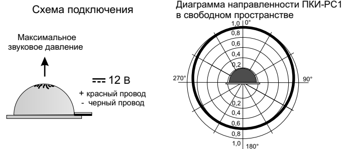
Рис.2 Схема подключения и диаграмма направленности Оповещателя ПКИ-РС1.

5.2. На рис.2 показана схема подключения и диаграмма направленности звука оповещателя ПКИ-РС1.