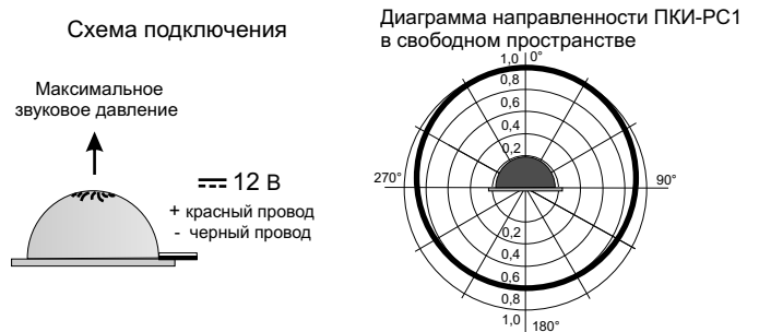
Рис.2 Схема подключения и диаграмма направленности Оповещателя ПКИ-РС1.

5.2. На рис.2 показана схема подключения и диаграмма направленности звука оповещателя ПКИ-РС1.