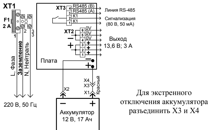
Рис. 3. Схема подключения