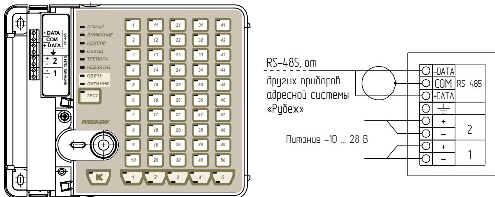
Рисунок 1 - Внешний вид и способ подключения прибора

Индикация приведена в таблице 3 (для примера указаны номера индикаторов для первых двух строк).